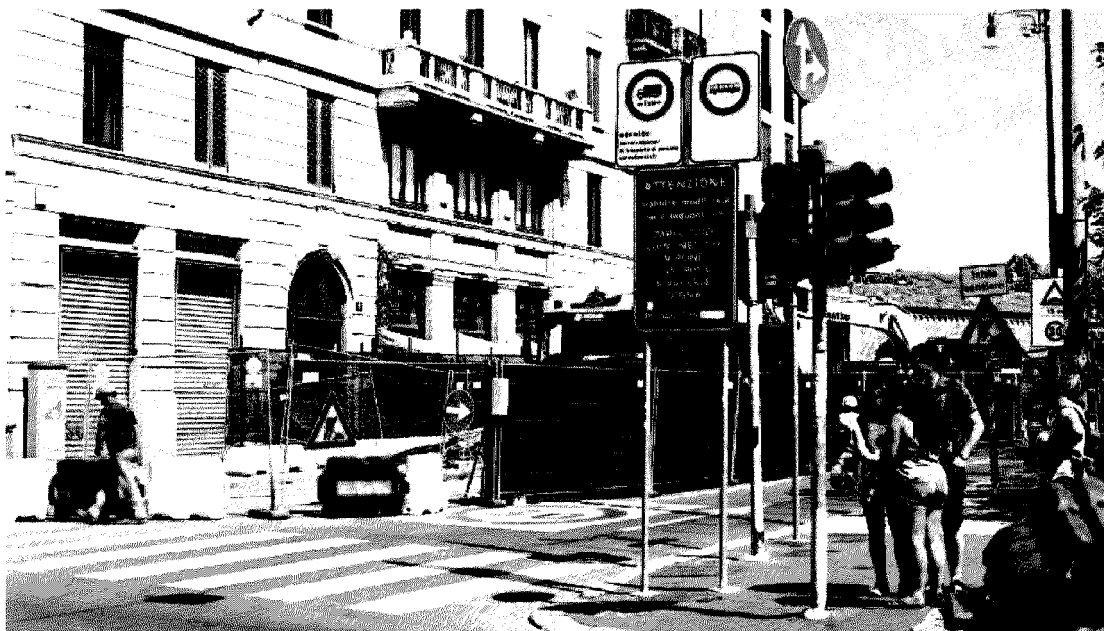
Il cantiere già aperto in un tratto di via San Vittore per costruire la stazione Sant' Ambrogio della M4

tivo: salvaguardare il rispetto dei tempi perché eventuali ritardi farebbero male alla città e ridurre il più possibile l'impatto dei cantieri».